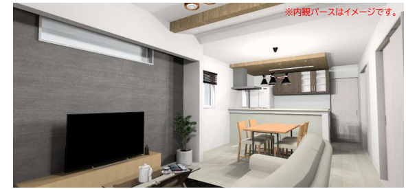
※内観パースはイメージです。

太陽光から様々な色を映し出すprismのように、 priSUMA~プリズマ~はあなたの新しい日常を彩ります。